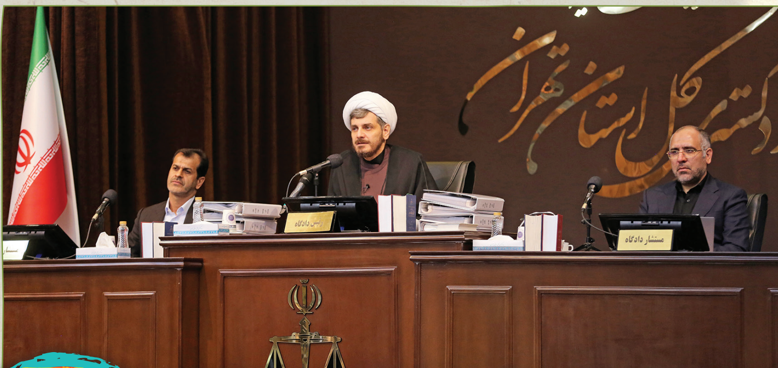
حضور خانواده های شهدای ترور در دادگاه محاکمه تروریست ها