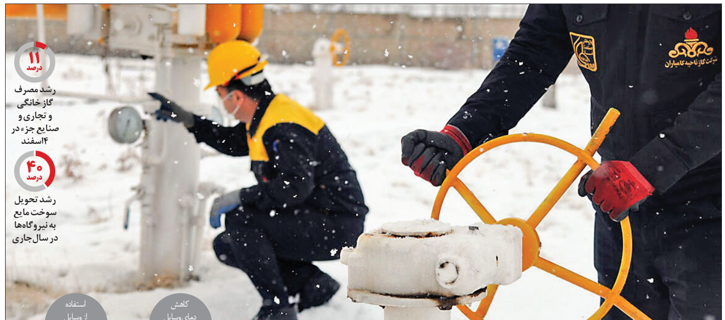
رشد مصرف گاز خانگی و صنایع جزء در ۱۴ اسفند ماه هدف مصرف بهینه و تامین سوخت، مردم را برای مشارکت در پویش «۲ درجه کمتر» دعوت کردند.

نسبت به تامین گاز در روزهای آینده که هوا سردتر می‌شود، نگران کرده است. دیروز در شرایطی که مسعود پزشکیان، رئیس‌جمهور برای چندمین بار هشدار داد این شش‌هفته مصرف انرژی، کشور را به بن‌بست می‌کشد، مسؤلان وزارت نفت هم از افزایش ۱۱ درصدی مصرف گاز طبیعی در بخش خانگی و تجاری و صنایع جزء در ۱۴ اسفند ماه هدف مصرف بهینه و تامین سوخت، مردم را برای مشارکت در پویش «۲ درجه کمتر» دعوت کردند.