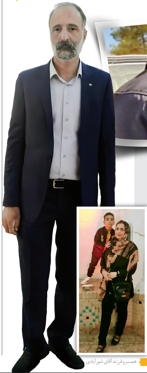
همسر و فرزند آقای شوروآبادی