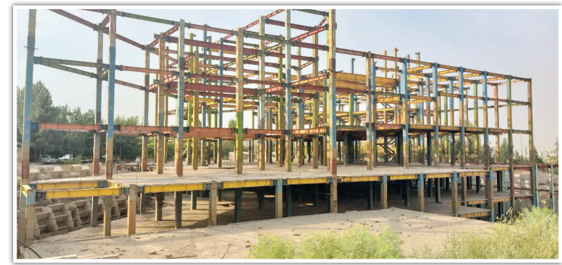
پروژه جهان‌دیدگان با هدف ارائه خدمات به سالمندان پایتخت به سرعت در حال اجراست.