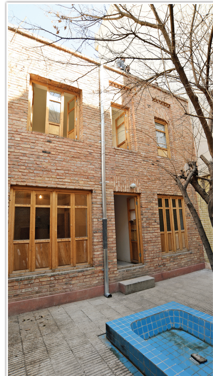
مرمت خانه‌موزه شهید تندگویان از سوی شرکت توسعه فضاهای فرهنگی در حال اجرا است.