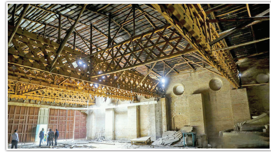
ایمن‌سازی و رفع خطر از آشیانه نخستین فرودگاه کشور از سوی شرکت توسعه فضاهای فرهنگی در حال انجام است.