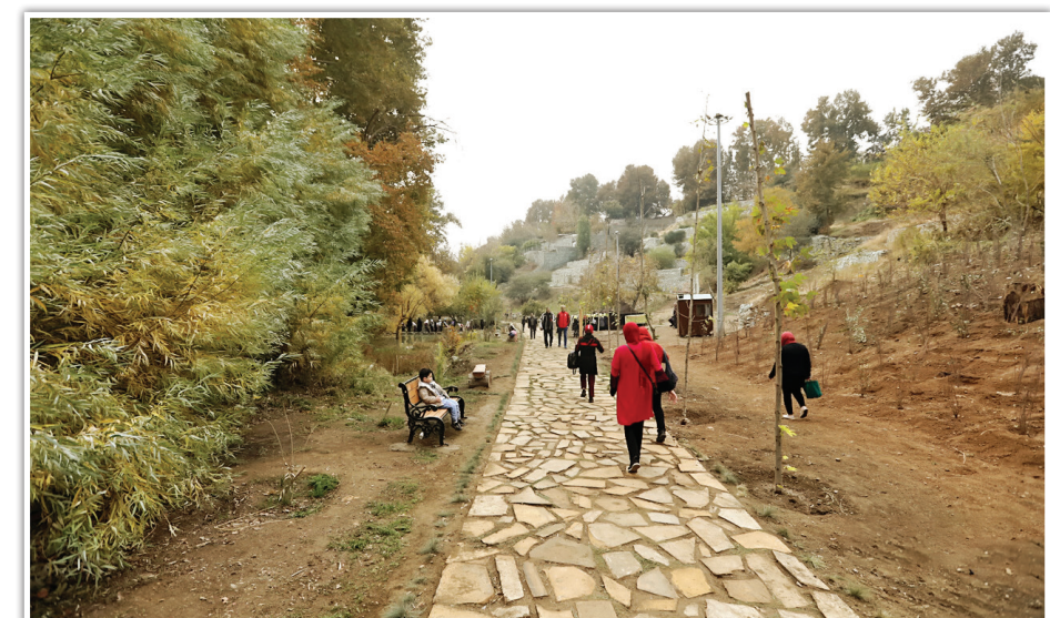
دره فرحزاد که سال‌ها به‌عنوان یکی از نقاط آسیب‌پذیر تهران شناخته می‌شد، اکنون با تلاش‌های مستمر مدیریت شهری، به اکوپارک زیبا تبدیل شده و پذیرای شهروندان است.