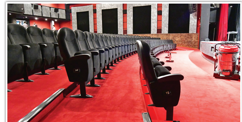
تجهیز تالار ایوان شمس از سوی شرکت توسعه فضاهای فرهنگی به انجام رسید.