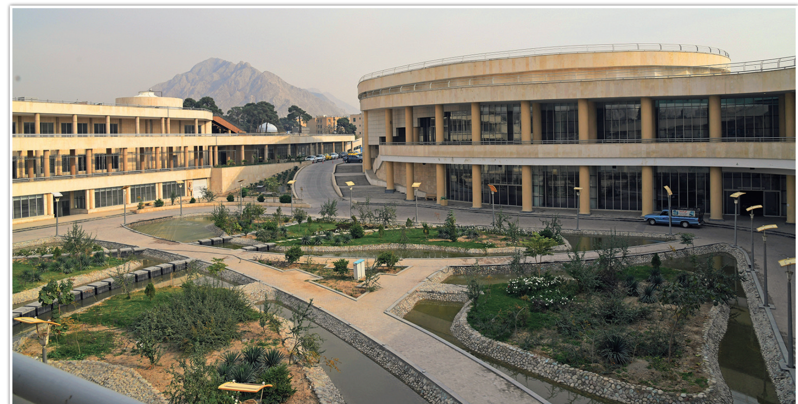
مجموعه فرهنگی، گردشگری، مذهبی ایوان ری به‌عنوان یکی از بزرگترین فضاهای فرهنگی پایتخت در حال بهره‌برداری است.