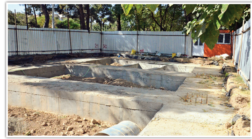
ژانرسرا در منطقه ۲۰ با هدف ارائه خدمات به زوار و مجاورین حرم عبدالعظیم حسنی (ع) در حال ساخت است.