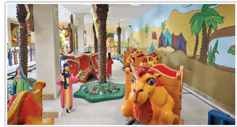
نخستین شهر بازی معارفی پایتخت از سوی شرکت توسعه فضاهای فرهنگی در مجموعه ایوان ری به بهره‌برداری رسید.