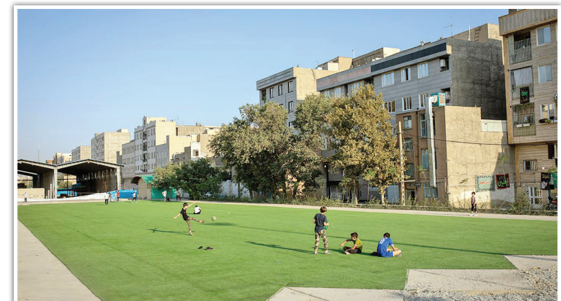
فاز نخست باغ راه حضرت فاطمه زهرا با اجرای طرح‌های فرهنگی و اجتماعی به بهره‌برداری رسیده است.