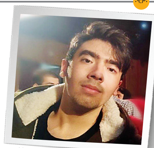
دانشجویی که قتل رسیده

خبر خوب امروز تعلق دارد به میزان تولید علم در ایران که به روایت سرپرست نهاد نمایندگی مقام معظم رهبری در بنیاد ملی نخبگان، ۲.۵ درصد حجم تولید علم دنیا را ایران در اختیار دارد و سرعت پیشرفت علمی کشور ۱۱ برابر سرعت دنیا است. حجت‌الاسلام سعید کریمی در نشست هم‌اندیشی نخبگان استان آصفهان به پیشرفت‌های علمی ایران پس از انقلاب اسلامی اشاره کرد و گفت: ایران از کشوری وابسته و عقب‌مانده، به تبه ۱۵ تولید علم دنیا رسیده است. حاضر هستند.