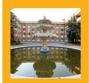
دانشجویان بصر از ۲۴ اصلی وارد خوابگاه می‌شوند؛ یکی از ورودی اصلی خوابگاه در خیابان کارگر شمالی ورودی دیگر هم در کوچه جنت و نزدیک شهرک کوی پروانه است.

علی صالحی، دادستان عمومی و انقلاب تهران از ترسیم جغرافیای جرم در تهران خبر داد و گفت: دادستانی تهران در قالب قرارگاه پیشگیری و مبارزه با سرقت، جلسات متعددی با فرماندهی انتظامی تهران برگزار کرده و پس از شناسایی مشکلات، برنامه‌ریزی‌های مناسبی برای رفع آنها انجام داده است. صالحی با تأکید بر اقدامات پیشگیرانه برای جلوگیری از وقوع جرائم در پایتخت، اضافه کرد: در مناطق مختلف پایتخت جغرافیای جرم تعریف شده است و با همکاری دادستانی تهران و دستگاه‌های متولی در حوزه پیشگیری، هم در حوزه کاهش آسیب‌های اجتماعی و هم در زمینه کاهش جرائم این اقدامات را به‌صورت جدی دنبال می‌کنیم. او افزود: البته امسال وقوع بزه سرقت روند کاهشی داشته و کشفیات حوزه سرقت و دستگیری‌های هدفمند سارقان افزایش یافته است. صالحی در این خصوص توضیح داد: البته با اقدامات دستگاه قضا و فراجا در زمینه مقابله با سرقت از ابتدای سال جاری نسبت به مدت مشابه در سال قبل شاهد کاهش ۱۸ درصدی سرقت بوده‌ایم.