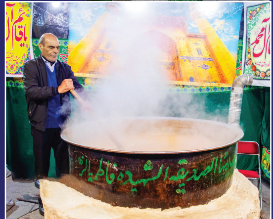
نذری دادن در روز نیمه شعبان از رسوم و آیین های قدیمی ایرانی هاست.