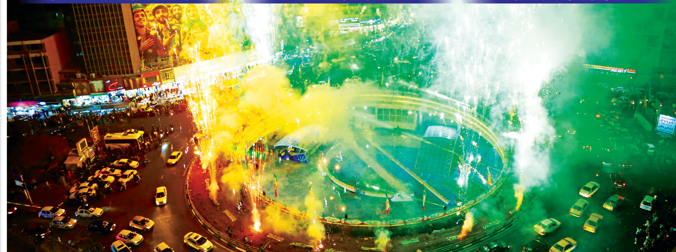
جشن میلاد امام زمان در میدان ولیعصر (عج) با حضور مردم و مراسم آتش بازی برگزار شد.