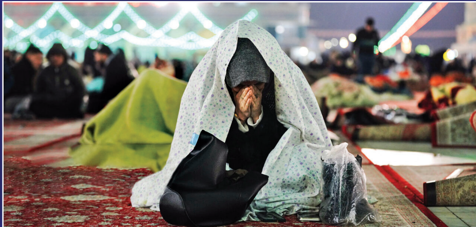
آیین احیای شب نیمه شعبان شب جمعه با حضور خیل گسترده زائران در حرم حضرت معصومه و مسجد جمکران برگزار شد.