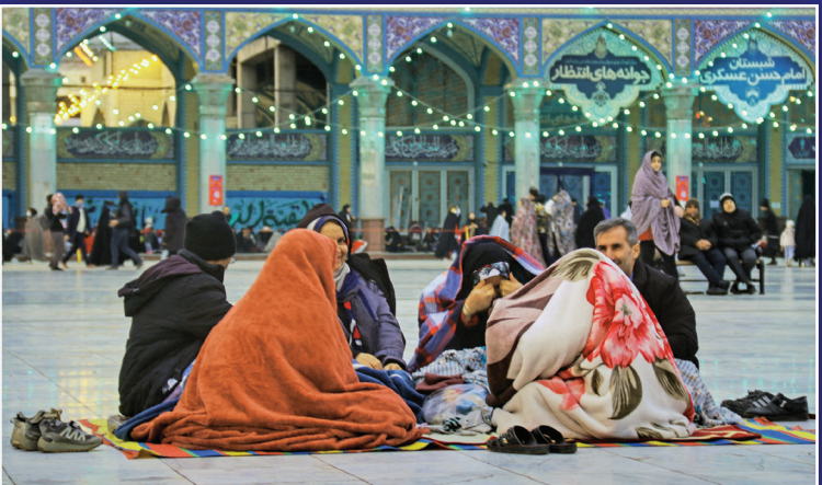
حضور منتظران امام زمان (عج) در آستان مبارک مسجد جمکران