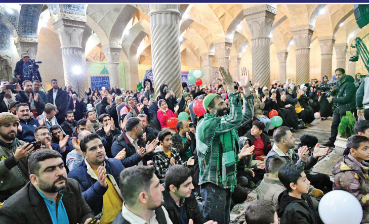
مراسم جشن نیمه شعبان در مسجد و کیل شیراز