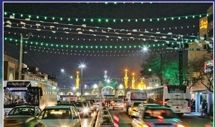
چراغانی خیابان های منتهی به حرم مطهر امام هشتم (ع)