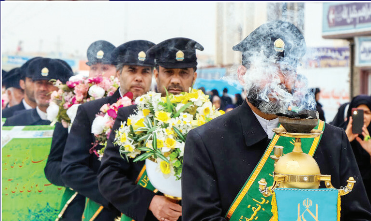
میزبانی مسجد جمکران از زائران: قم خود را برای میزبانی از ۵ میلیون زائر آماده کرده بود.