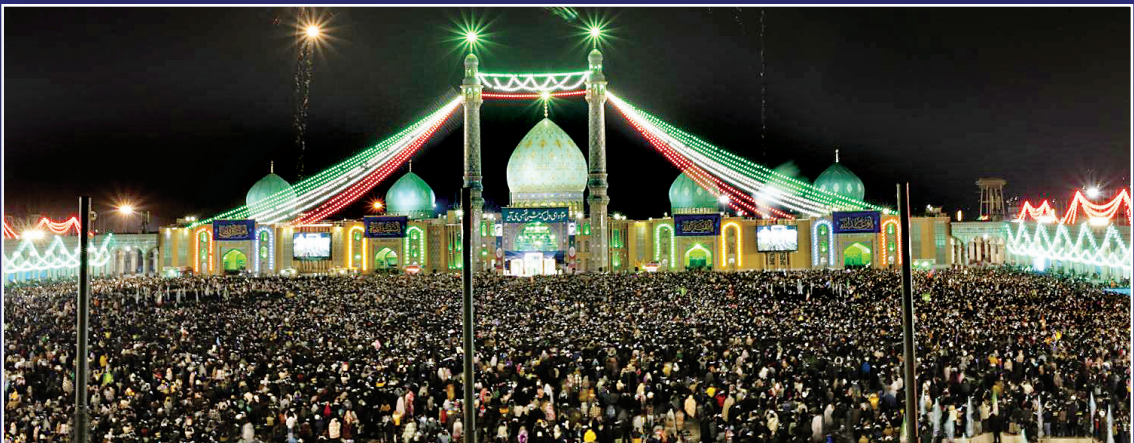
جشن بزرگ میلاد امام زمان (عج) با حضور میلیونی ها ایرانی از سراسر کشور برگزار شد و پیر و جوان عشق خود را به آقایشان در جمکران ابراز کردند.