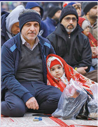
حضور کودک و پیر و جوان در صحن مسجد جمکران