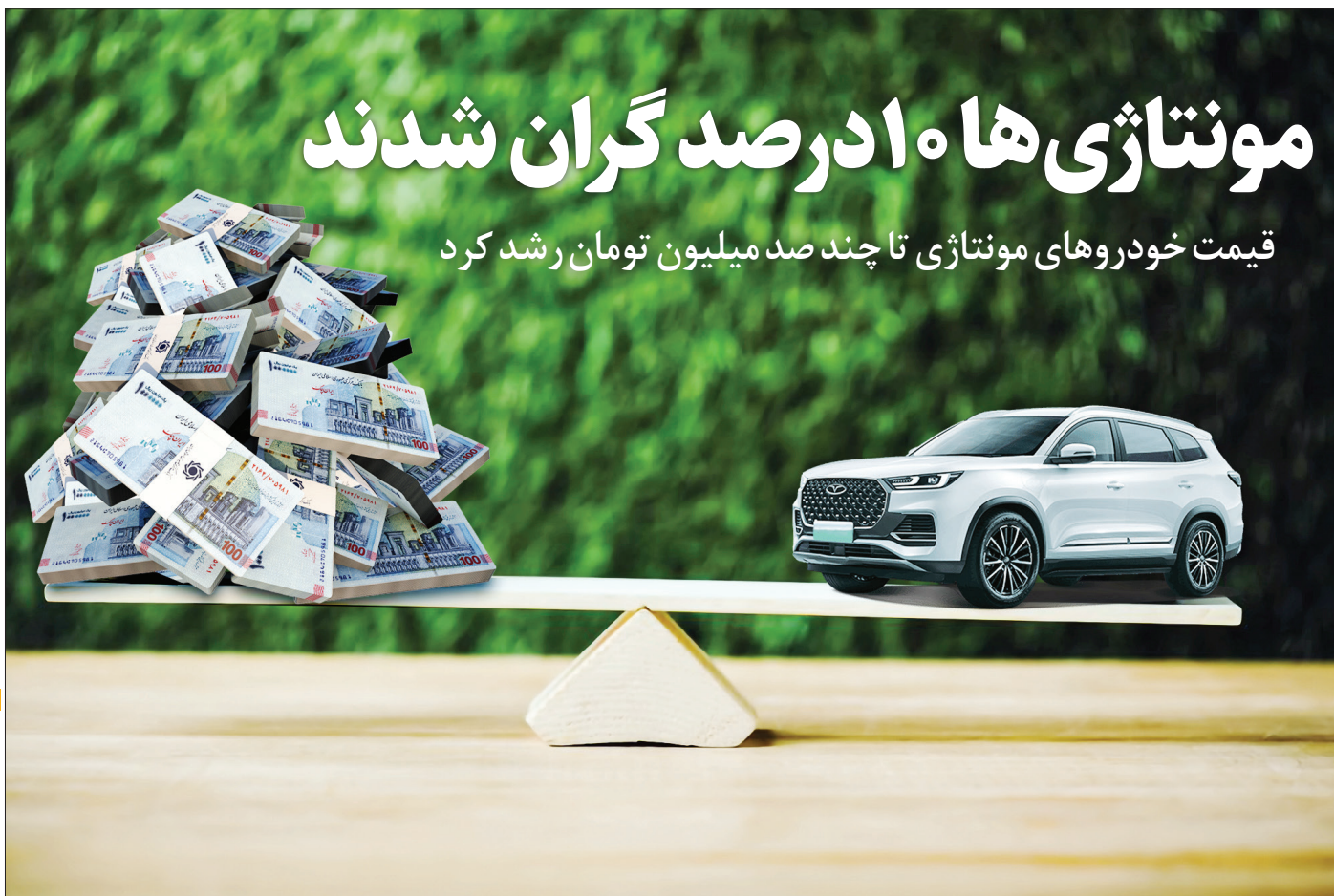
طرح همشهری / رضا احمدوند

قیمت خودروهای مونتازی تا چند صد میلیون تومان رشد کرد