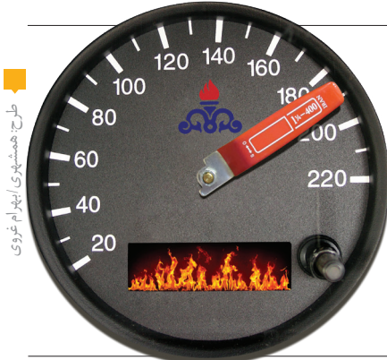
طرح همشهری: ایلام غریز

مدیرعامل شرکت ملی گاز ایران می‌گوید: شبکه گاز کشور پایدار است و هیچ‌گونه قطعی گزارش نشده است، اما گزارش‌ها از اختلال و قطع جریان گاز در برخی شهرها و روستاهای استان مازندران حکایت دارد. خطر قطع گاز با شتاب مصرف در روزهای سرد پیش‌رو قوت گرفته است. به گزارش همشهری، مدیرعامل شرکت ملی گاز مازندران دلیل قطع و افت فشار گاز در برخی مناطق استان را بردت بالای هوا و افزایش مصرف گاز اعلام کرد. هزبر جوادی با