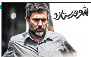
حامد بهداد در جشنواره امسال با فیلم «شوهر ستاره» حاضر است.