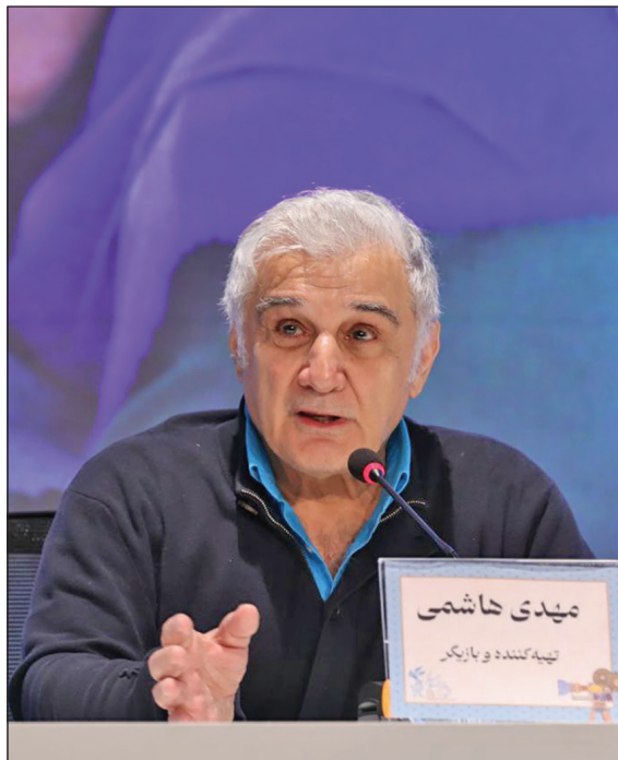
مهدی هاشمی، تهیه کننده و بازیگر «مرد آرام»