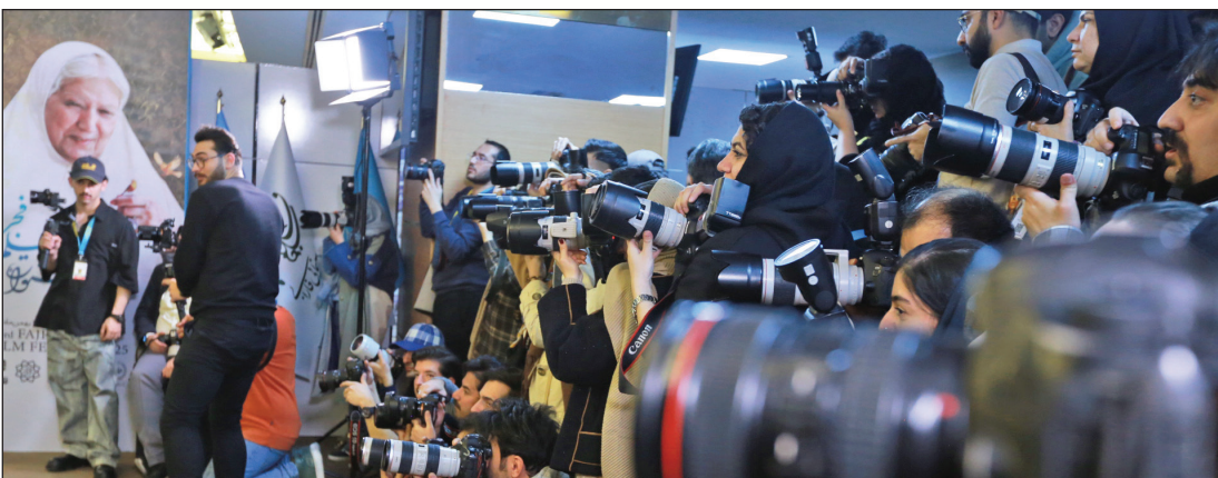
حضور خستگی ناپذیر عکاسان در ششمین روز جشنواره