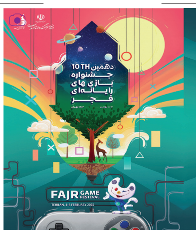
آغاز جشنواره بازی‌های رایانه‌ای فجر

دهمین دوره جشنواره بازی‌های رایانه‌ای فجر به کوشش بنیاد ملی بازی‌های رایانه‌ای و با رقابت بازی‌سازان برتر کشور همزمان با ایام الله دهه مبارک فجر طی ۳ روز از ۱۶ تا ۱۸ بهمن‌ماه برگزار می‌شود. در این رویداد بهترین‌های صنعت بازی ایران حضور خواهند داشت. این جشنواره در بخش نمایشگاهی-کارگاهی و بخش رقابتی برگزار می‌شود.