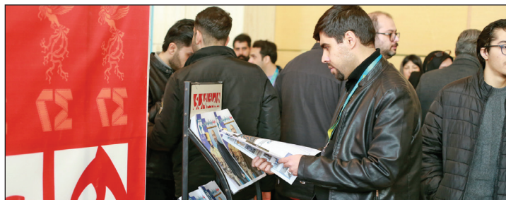
غرفه همشهری و دومین روزنامه جشنواره فیلم فجر