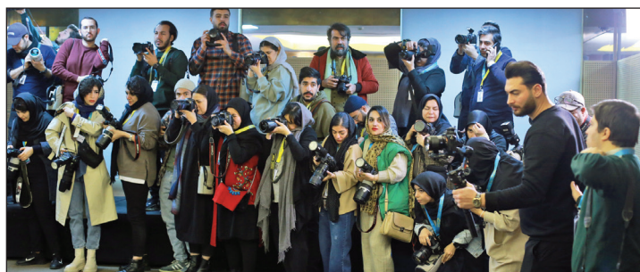
در حال شکار سوژه. حضور پررنگ عکاسان در برج میلاد