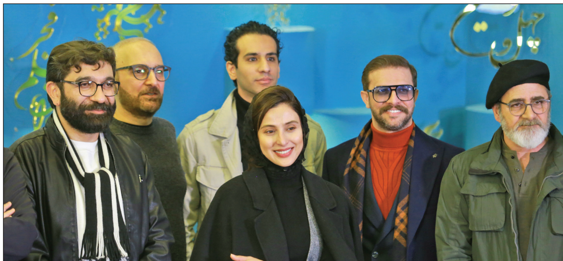
فتوگال گروه سازنده «آنتیک»؛ فیلمی که برج میلاد را در روز دوم جشنواره شلوغ کرد.