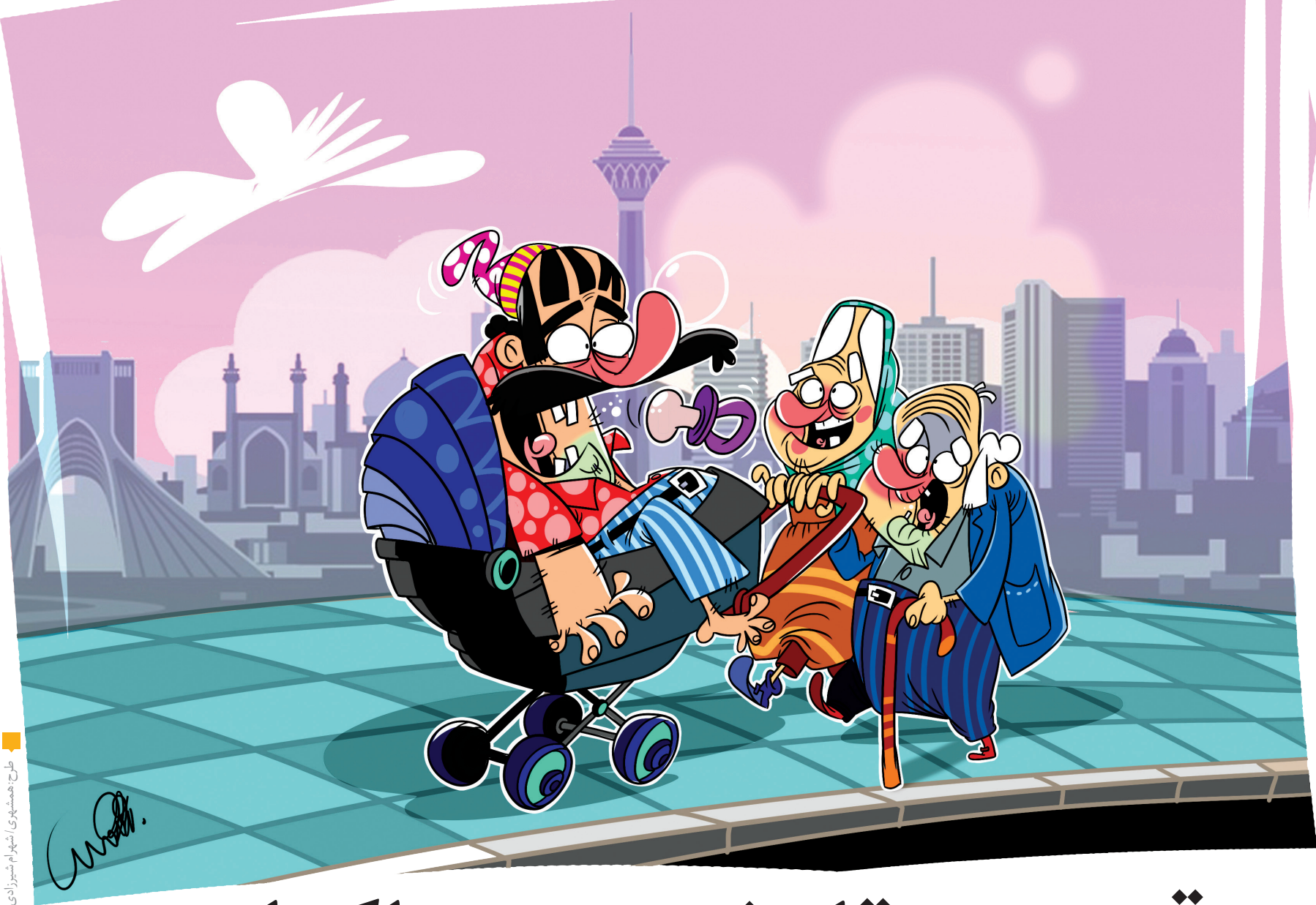
طرح همشهری شهرام شهبازی