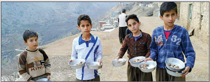
توزیع گردو و حضور کودکان