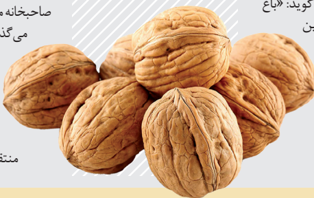
پیر شالیبار که بود؟

یک عصر پنجشنبه، کودکان و نوجوانان به خانه متولی گردو می‌روند و در آنجا با نسبتی مساوی گردوها را داخل کاسه‌هایی می‌ریزند. بچه‌ها مسئول توزیع گردو هستند و در خانه‌ها می‌روند و کاسه گردو را در اختیار صاحبخانه می‌گذارند. صاحبخانه هم وقتی گردو را تحویل می‌گیرد، داخل کاسه چیزی مانند رب انار یا آرد می‌گذارد و به بچه‌ها برمی‌گرداند. فردی که مسئول این کار است به زبان کردی «زیزوان» نامیده می‌شود. رستم‌زاده می‌گوید: «اگر بعد از تقسیم گردو چیزی اضافه آمد، آن را به روستاهای اطراف مانند سرپیر، کماله، رودر، بلبر و ویسیان می‌برند. داوطلبان شرکت‌کننده در این مراسم همگی از سر ذوق و احساسات پاک کودکان و همیاری در پخش گردوها شرکت می‌کنند. آنها در قبال این کار هیچ دستمزدی دریافت نمی‌کنند. بعد از پخش تمام گردوها، آرد یا دیگر موارد گردآوری‌شده به خانه پیر شالیبار منتقل می‌شود تا در روز مراسم از آنها برای تهیه غذای مخصوص استفاده شود.»