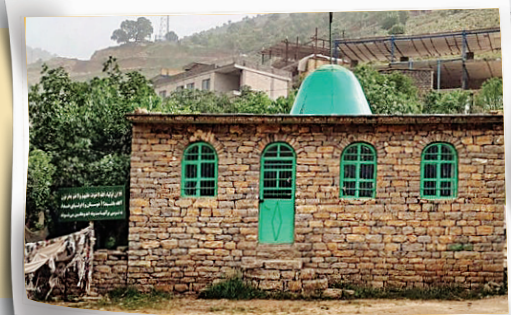
خانه پیر شالیبار

پیر شالیبار شخصیتی اسطوره‌ای - تاریخی است که صدها سال پیش می‌زیسته و می‌توان گفت به معنای شاه شاهان یا پیر پیران است. از دیدگاه عامه مردم که تحت تأثیر دین اسلام قرار دارند، پیر شالیبار نام دوم سیدمصطفی است که حضرت محمد(ص) را به خواب می‌بیند و به اسلام می‌گردد و سپس کتاب «معرفت پیر شالیبار» را تغییر می‌دهد و در آن درباره دین اسلام می‌نویسد و نام خود را به مصطفی پسر خداداد تغییر می‌دهد.