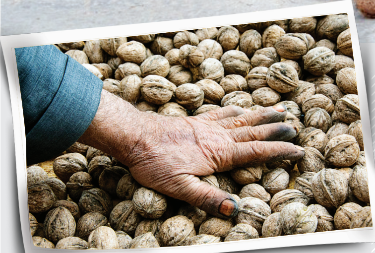
نگهداری و برداشت گردو