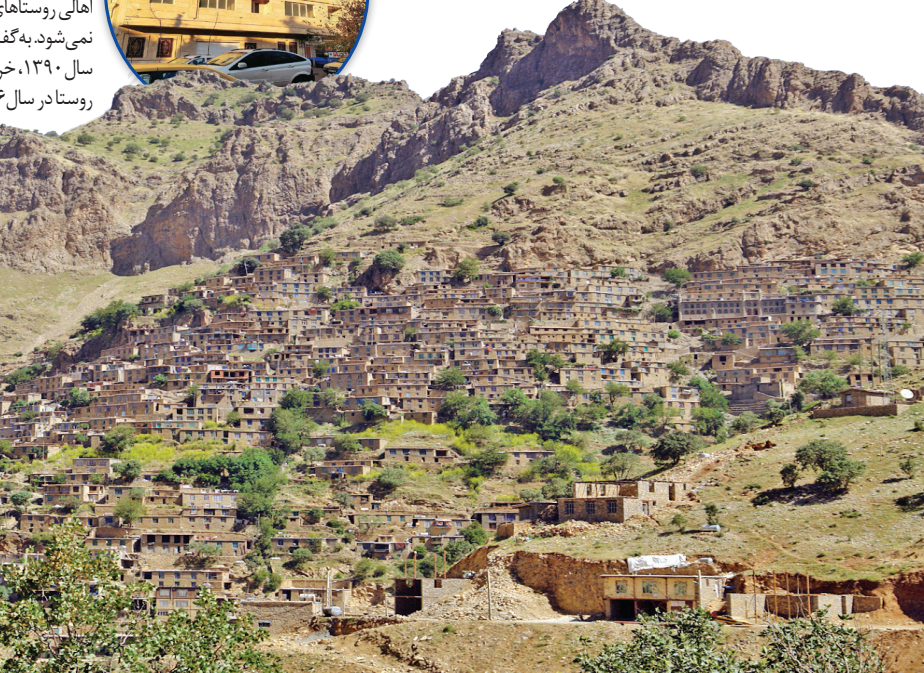
عکس همشهریان تکمیل‌شده

سفر همیشه هم دوست‌داشتنی نیست؛ آن هم وقتی کوله‌بار مختصری یرمی‌داری و به قصد رفتن به د کتر و درمان راهی شهر دیگری می‌شوی. اگر این شهر، پایتخت همیشه‌شلوغ باشد و محلی هم برای استراحت و شب ماندن نداشته باشی، رنج بیماری بی‌حساب و کتاب بیشتر می‌شود. این تجربه ناخوشایند بسیاری از اهالی روستای بلبر است؛ روستایی در اورامانات کردستان. یک ماهی می‌شود که اهالی روستا با همت جمعی خود یک واحد آپارتمان خریده‌اند تا زمانی که هر خانواده‌ای از روستا برای مداوا راهی تهران شد، سرگردان نباشد و جایی برای اسکان داشته باشد؛ اسمش را «پانه باوان» گذاشته‌اند؛ یعنی خانه پدری.