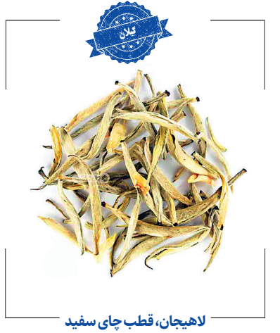
لاهیجان، قطب چای سفید

شهرستان رودسر ۲۰ درصد سطح زیرکشت باغ چای کشور را به‌خود اختصاص داده و سهم ۲۰ درصدی در تولید چای خشک ایرانی را دارد. سطح زیرکشت باغ‌های چای در شهرستان رودسر بیش از ۵۰۰۰ هکتار است و سالانه حدود ۲۵ هزار تن برگ سبز از این گیاه برداشت می‌شود. ۳۰ کارخانه چای‌سازی در سطح شهرستان اقدام به خرید برگ سبز و تولید چای خشک می‌کنند.