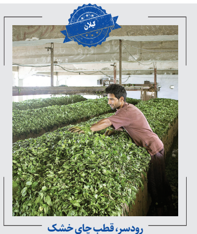
رودسر، قطب چای خشک

شهرستان دلگان در استان سیستان و بلوچستان رتبه نخست تولید چای ترش در کشور را به‌خود اختصاص داده است. چای ترش یا همان مکی به‌صورت گسترده در جنوب کشت می‌شود. ۵۶۰ هکتار از اراضی کشاورزی شهرستان به کشت این گیاه دارویی اختصاص دارد و سالانه از هر هکتار ۸۰۰ کیلوگرم چای ترش برداشت و وارد بازار می‌شود. سیستان و بلوچستان ۶۵ هکتار باغ چای ترش دارد.