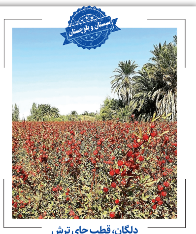
دلگان، قطب چای ترش

بیش از ۹۰ درصد چای ایرانی در گیلان تولید می‌شود و شهرستان املش در این استان با ۴۸۵۰ هکتار باغ چای قطب چای محسوب می‌شود. سالانه ۳۰ هزار تن برگ سبز چای از املش برداشت می‌شود. املش با ۳۲ درصد تولید چای، بزرگ‌ترین تولیدکننده چای محسوب می‌شود. همچنین تنها باغ پلکانی چای در شرق گیلان که مشابه باغ‌های چای ژاپنی است، در روستای «تارمه‌سرا» واقع در بخش زانکوه املش قرار دارد.