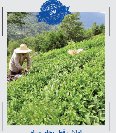
املش، قطب چای سیاه

هر چند لاهیجان پایتخت چای ایران لقب گرفته، اما طبق آمار این شهرستان بزرگ‌ترین تولیدکننده چای در ایران نیست و این جایگاه در اختیار املش است.