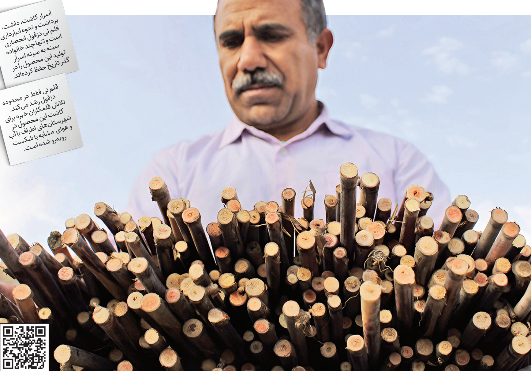
قلم گزاش را با اسکن این کد پیوند.