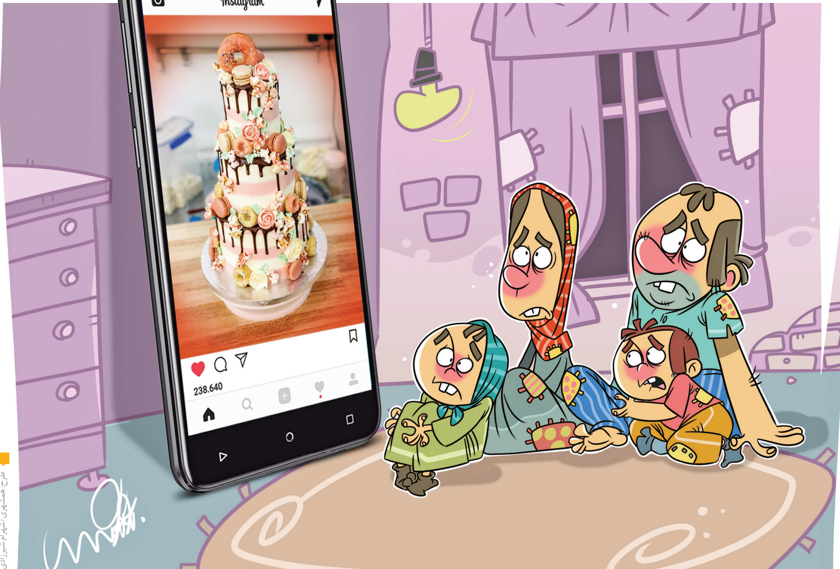
طرح همشهری/انتهام سیربازاری