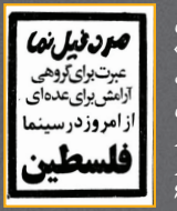
مرد فیل نما