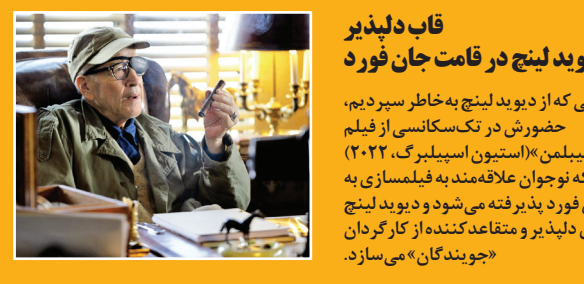
قاب دلپذیر دیوید لینچ در قامت جان فورد

دیوید لینچ از ۱۹۸۶ که با «مخمل آبی» چشم‌ها را خیره کرد تا سال ۲۰۰۱ که با «جاده‌ماله‌لند»ش دوستدانش را هیجان‌زده کرد. در اوج به سدر می‌پرد. در میانه این فیلم‌ها، «از ته دل وحشی» (۱۹۹۰) «توئین بیگس: با من به آتش برو» (۱۹۹۲)، «بزرگراه گمشده» (۱۹۹۷) و «داستان