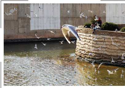
مهمان زمستانی شیرازی‌ها