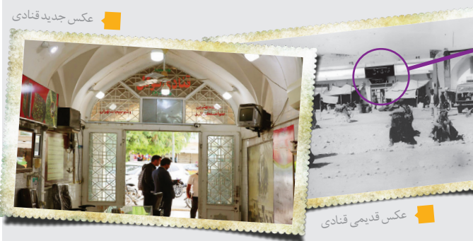
عکس جدید قنادی