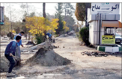
خدمات حوزه فضای سبز شامل چه مواردی است؟