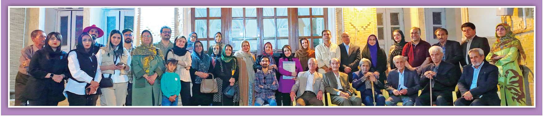
سیدمحمد آریزاده در بوشهر

به گزارش ایرنا، شاپور رجایی‌افزود: در موضوعی مهم مانند آلودگی نفتی خلیج فارس، تمام دستگاه‌های مرتبط باید در ارتباطی هماهنگ و مؤثر با یکدیگر باشند و با هدف پیشبرد بهتر اهداف، تبادل اطلاعات آنها باید در کوتاه‌ترین زمان ممکن، دقیق و مبتنی بر نگاه واقعی و کارشناسانه باشد. به گفته او، بهره‌برداران تأسیسات نفتی نیز باید همگام با اجرای طرح‌های توسعه در یامحور، اقدامات پیشگیرانه را در دستور کار قرار دهند.