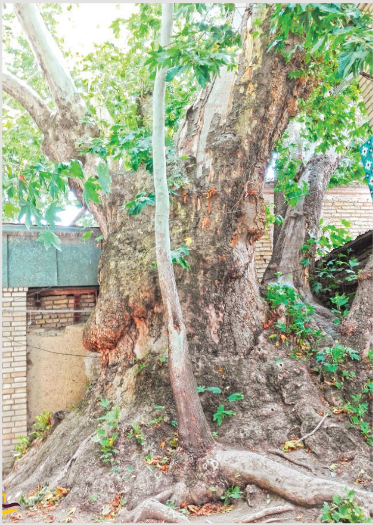
عکس: چنار ۲ هزار ساله روستای سنقرآباد