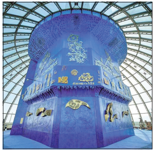
گنبد آسمان، بالاترین طبقه از برج میلاد تهران است و در ارتفاع ۲۰۲ متری قرار گرفته است.