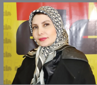
شکل بر ملا شود.