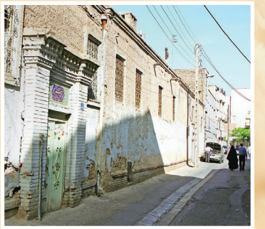
زمستان ۱۳۸۰ تهران

میدان سرتخت از ۴ طرف به مسجد سرتخت باقر العلوم (ع)، کوچه سلام، کوچه جاده قم و بازار بزرگ ری می رسد. اهالی کوچه های میدان سرتخت برای رسیدن به حرم حضرت عبدالعظیم (ع) عرض سلام به آن حضرت باید از کوچه ای گذر می کردند. وقتی که چشم شان به بارگاه منورباز می شد به حضرت سلام می دادند. به همین خاطر این کوچه به «کوچه سلام» معروف شده است. از ابتدای کوچه، گنبد زیبای حرم حسنی پیدا بود. آنها همانجا می ایستادند به رسم آداب دست بر سینه می گذاشتند و در همان حال خدمت عبدالعظیم (ع) سلام می دادند.