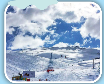
پیست اسکی دیزین

اگر فکر می‌کنید که با تمام شدن پاییز و شروع زمستان زیبایی‌های طبیعت هم تمام می‌شود و باید خانه‌نشین شوید سخت در اشتباهید. باید بدانید که تفریحات زمستانی از هیجان‌انگیزترین تفریحات هستند که می‌توانید برای سساختن روزهای متفاوت و جذاب به سراغشان بروید. تهران هم که چیزی برای تفریح و خوش گذرانی کم ندارد. زمستان تهران دیدنی‌ها