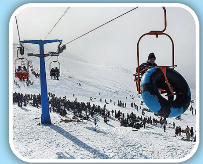
پیست اسکی ابعلی