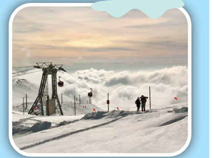
پیست اسکی توچال

پیست اسکی ابعلی قدیمی‌ترین پیست اسکی از مجموعه‌های تفریحی تهران و نخستین جایی است که دستگاه‌های الابر در سال ۱۳۳۲ آنجا نصب شد. البته پیست اسکی ابعلی فقط مخصوص اسکی‌بازان نیست، بلکه گردشگران زیادی برای عکاسی، برف‌بازی و تیوب‌سواری به این مکان زیبا می‌آیند. پیست اسکی ابعلی امکانات زیادی مثل مدرسه اسکی، سوارکاری، کایت‌سواری، باشگاه تنیس، پارکینگ، رستوران، تله‌کابین، تله‌سیز و تله‌اسکی را برای گردشگران و اسکی‌بازان تدارک دیده است. همیشه پای ثابت آن بوده‌اند.