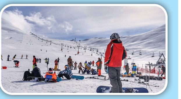
پیست اسکی شمشک

یکی از پیست‌های جذاب تهران که سال ۱۳۶۱ راه‌اندازی شده اسکی دربندسر است که در شمال شرقی تهران بخش رودبار قصران واقع شده است. این پیست در ۳ ماه زمستان شرایط خوبی برای اسکی و برف‌بازی دارد، البته کمی شیب آن زیاد است که برای بالا رفتن از آن می‌توانید از تله‌کابین استفاده کنید. در این پیست برای افراد مبتدی پیست مجزا همراه با یک تله‌اسکی بشقابی برای بالا بردن اسکی‌بازان وجود دارد. پیست اسکی شب دربندسر تنها مختص افراد حرفه‌ای است و افراد مبتدی نمی‌توانند از آن استفاده کنند.