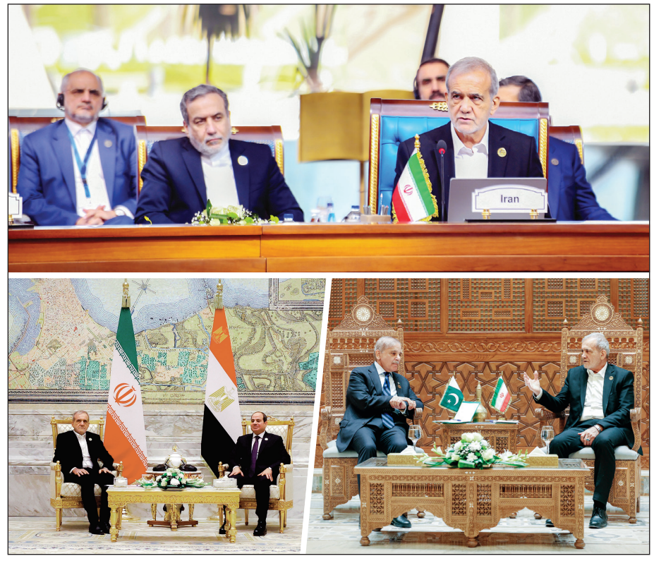
گزارش: علیرضا احمدی روزنامه‌نگار

این روزها سوریه به زمین بازی تازه‌ای برای پیگیری کلان‌راهبرد منزوی‌سازی ایران تبدیل شده است