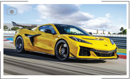
سریع‌ترین کوروت تاریخ

شورولت اعلام کرد که ZR1 جدید سریع‌ترین کوروت تاریخ است. مهندسان این شرکت، ZR1 را در بیست بیضی‌شکل مرکز آزمون خودروبی ATP در پانینورگ آلمان مورد آزمایش قرار دادند و نتایج شگفت‌انگیزی به دست آوردند. طبق آزمایش‌های انجام‌شده، سرعت این شورولت کوروت به ۳۷۳کیلومتر در ساعت رسید. این درحالی بود که این شورولت توانست در زمان ۲۰٫۳ثانیه به سرعت ۹۶کیلومتر در ساعت برسد و بدین‌ترتیب لقب سریع‌ترین کوروت تاریخ را به نام خود ثبت کند.