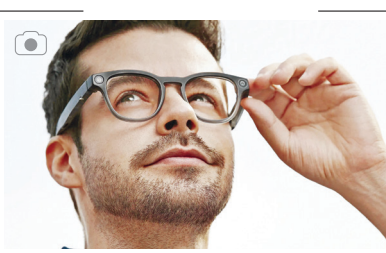
عینک هوشمند، اما شیک

شرکت فناوری چینی با همکاری هم، شیک ترین عینک های هوشمندی را که تاکنون دیده ایم تولید کرده اند. این عینک ها که به ابزارهای هوش مصنوعی چت جی پی تی 40 و چمنای و همچنین سیستم ابری مجهز شده اند، فراتر از یک محصول صرفاً شیک به نظر می رسند. این عینک های هوشمند که قرار است در نمایشگاه الکترونیک مصرفی ۲۰۲۵ رونمایی شوند در واقع دستیارهای صوتی تصویری هوش مصنوعی پوشیدنی هستند که می توانند اشیا را شناسایی، متون را ترجمه و یادآوری ها را تنظیم کنند و در عین حال به پرسش ها پاسخ دهند.