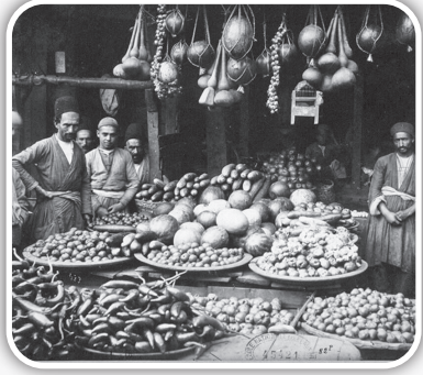
مردم در بازارهای تهران قدیم، وقت خرید، عادت خاصی داشتند: ناخنک زدن! انگار بخشی از آداب خرید بود.

دست که دراز می شد، بهترین خوشه انگور، درشت ترین پسته یا خوش رنگ ترین آلو به غنیمت می رفت. انگار هر چه مرغوب تر، حق ناخنک زدن بیشتر! کاسب ها اما دل خوشی از این ماجرا نداشتند... کاسب: نگاه چطو دونه در دشت خرما خراکی های نازنین مو که عینهو یاقوته و تازه از شیراز اومده مثل حب انداخ بالا... د آخه لامصب اقلا از ته ریسسه انجیر بکن. اون درشت وسطو چکار داری... لعنت به دل سیاه شیطون... عیب نداره ه مشتت علی، بذار وردان بیشتر می خرن...!...!... میوزو مشتت کرد و ریخت خندق بالا... به جور بزتم ریختی دربیاد ها!