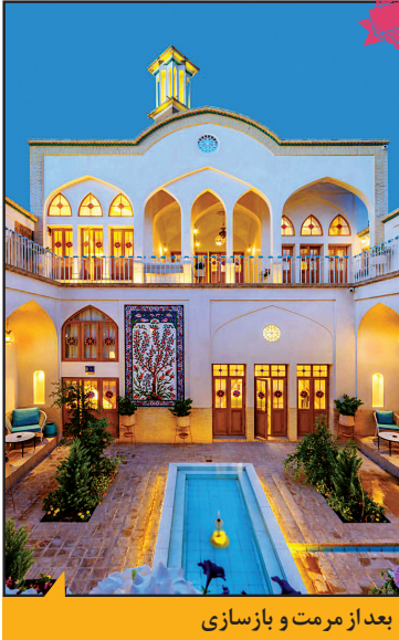
بعد از مرمت و بازسازی