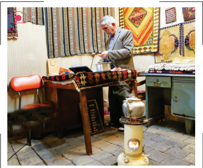
سوز سرما در بازار تبریز

سرمای شدید هوا در آستانه شب یلدا بازاریان و کسبه تبریز را مجبور به پناه بردن به داخل حجره‌ها و استفاده از کیسه‌های پلاستیکی برای جلوگیری از نفوذ سرما کرده است. آنها با جمع شدن در کنار بخاری‌های نفتی، برقی و چراغ علاءالدین سعی در تأمین گرما دارند. دستفروشان نیز با استفاده از پتو روی علاءالدین و برپایی کرسی‌های کوچک در تلاشند تا دست‌ها و پاهای خود را در سوز و سرمای بازار گرم نگه دارند.