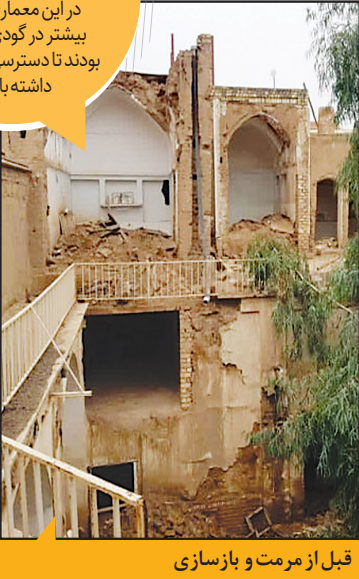
قبل از مرمت و بازسازی

معماری این خانه متروکه به زمان قاجار برمی‌گردد و گودال باغچه (باغچال) بوده که معماری اقلیم مناطق کویری است. در این معماری خانه‌ها بیشتر در گودی فرو رفته بودند تا دسترسی به آب روان داشته باشند