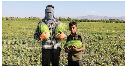
آغاز برداشت هندوانه شب پلدا