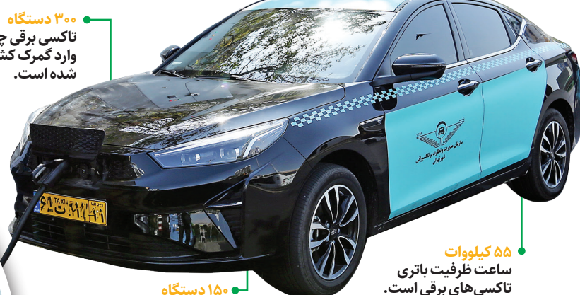
۵۵ کیلووات ساعت ظرفیت باتری تاکسی‌های برقی است.