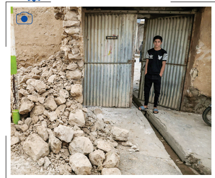
ارزیابی خسارت زلزله

زمین لرزه‌ای به بزرگی ۵.۶ درجه در مقیاس امواج درونی زمین (ریشتر) صبح پنجشنبه (۱۵ آذر) شهرستان هفتکل خوزستان را لرزاند. به دنبال این زمین‌لرزه، روزهای پیشین و جمعه چند پس لرزه هم به وقوع پیوست و به گفته مجید جودی، معاون مسکن روستایی بنیاد مسکن، ارزیابی خسارت وارد شده به مسکن روستایی و شهری هفتکل و مسجد سلیمان در حال انجام است.