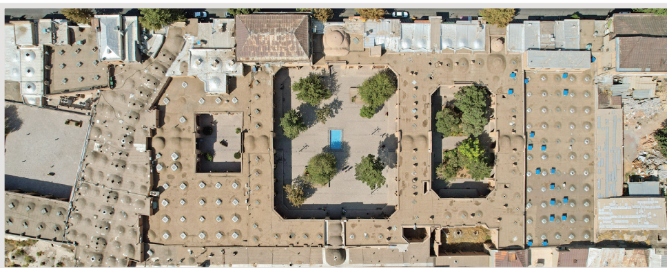
رصدخانه کشف شده خواجه نصیرالدین طوسی

با اسکن کیوآرکد مستند این گزارش را ببینید.