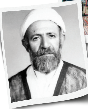
علامه میرزا ابوالحسن شعرانی

مداح و از بازنشستگان سپاه پاسداران انقلاب اسلامی که سال‌ها خادمی این مسجد را کرده است از پیشینه آن بیشتر باخبر است. او می‌گوید: «بنای این مسجد در سال ۱۲۷۳ قمری ساخته شده و در سال ۱۳۹۲ قمری تجدید بنا شده است. این مسجد در دوران ستم‌شاهی پایگاه انقلابیون بود و آیت‌الله ابوالحسن شعرانی سال‌ها به‌عنوان امام جماعت مسجد در آن نماز جماعت می‌خواندند. جلسات قرآن ایشان در این مسجد بسیار مشهور بود و فعالیت‌های قرآنی من پای منبر ایشان شکل گرفت.»