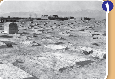
گورستان مسگر آباد شرق تهران در دهه ۳۰ شمسی