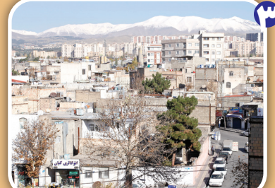
نمای عمومی از محله مسگر آباد

برخی اینجا را ریه‌های شرق تهران می‌دانند؛ اینجا مسگر آباد است؛ جایی در منطقه ۱۵ تهران، در همسایگی شهرک مسعودیه و در محله افسریه؛ قدمت سکونت در این روستای حاشیه شهر که حالا سال‌هاست به شکل یک منطقه‌ای مستقل به شرق تهران ملحق شده به بیش از ۲۰۰ سال می‌رسد، اما در گذشته‌های دور و در دوره ناصرالدین‌شاه، اینجا روستایی سرسبز با درخت‌های انار و قناتی برآب در میان کوه‌ها بوده که شاه قاجار، برای شکار به آنجا آمده و از ارتفاعات آن، بالا و پایین