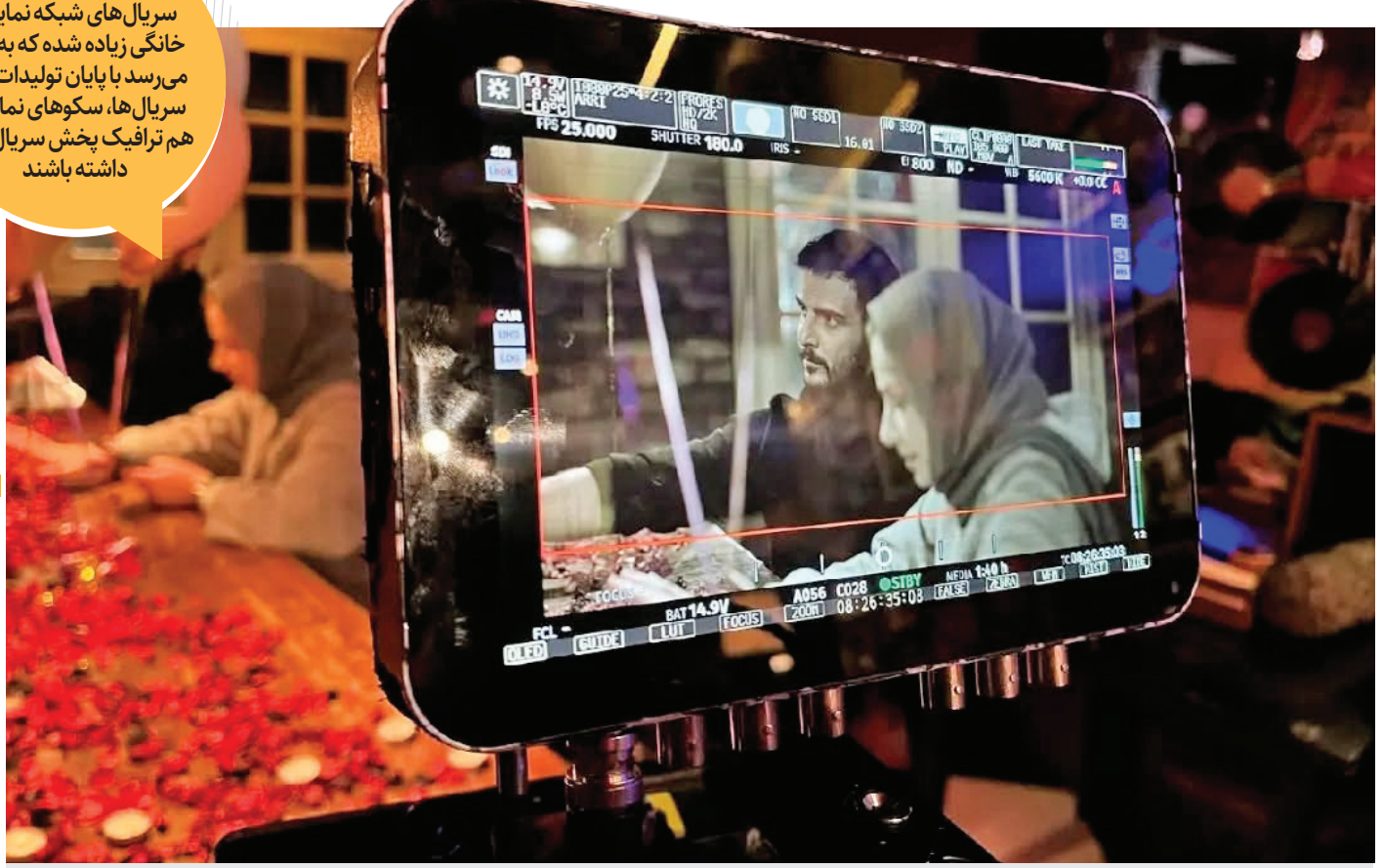
پشت صحنه سریال «بی‌عاطفه» به کارگردانی کمال تبریزی

آنقدر تولید سریال‌های شبکه نمایش خانگی زیاده شده که به نظر می‌رسد با پایان تولیدات این سریال‌ها، سکوی نمایش هم ترافیک پخش سریال‌ها را داشته باشند