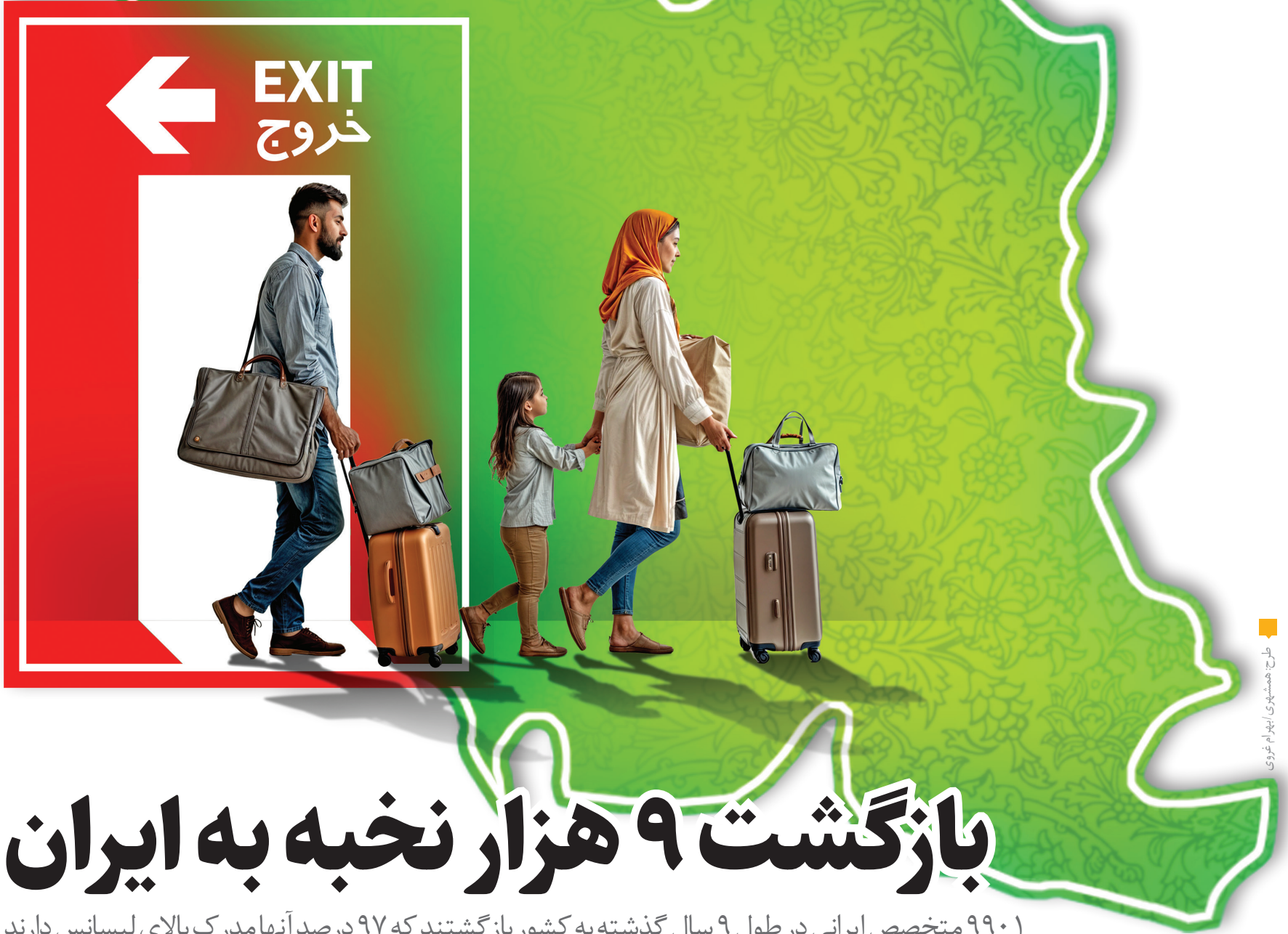
طرح: همشهری/انتهام غمخواری