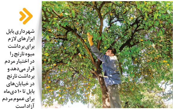
طرح نفی نوسازی طرح آبنده در شهرستان بابل اجرامی شود؛ در این طرح ۱۲۰ هزار درخت از جمله نارنج از سوی شهروندان و با کمک شهرداری کاشته می‌شوند