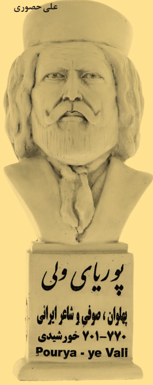
پوریای ولی پهلوان، صوفی و شاعر ایرانی ۱۳۷۰-۲۰۱ خورشیدی Pourya - ye Vali

منبع: کتاب «سفارت نامه خوارزم»، رضاقلی‌خان هدایت به کوشش علی حمصوری