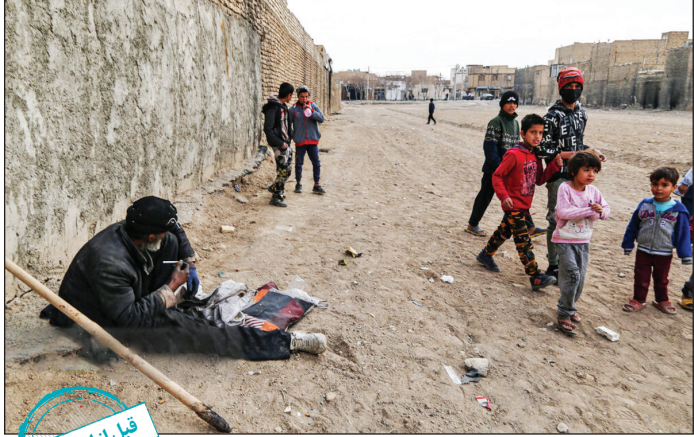
قبل از اجرای طرح