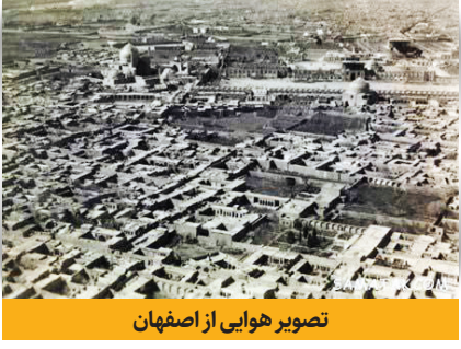
تصویر هوایی از اصفهان

اصفهان، نصف جهان، شهر گنبدیهای فیروزه‌ای و پایتخت فرهنگی جهان اسلام لقب گرفته است؛ شهری که یک جهان‌شهر است و ناصر خسرو در شرح آن می‌نویسد: «شهری است بر هامون نهاده، آب‌وهوایی خوش دارد و هر جا که ۱۰ گز چاه فرو بردند آبی سرد خوش بیرون آید و شهر دیواری حصین بلند دارد و دروازه‌ها و جنگ‌گاه‌ها ساخته و بر همه بارو و کنگره ساخته و در شهر جوی‌های آب روان و بناهای نیکو و در میان شهر مسجد آدینه بزرگ نیکو و باروی شهر را گفتند سه‌فرسنگ‌ونیم است و اندرون شهر همه آبادان که هیچ از وی خراب ندیدم و بازارهای بسیار، و بازاری دیدم از آن صرافان که اندر او دویست مرد صرف بود و هر بازاری را درندگی و دروازه‌های و همه محلت‌ها و کوچه‌ها را همچنین دربندها و دروازه‌های محکم و کاروانسراهایی پاکیزه بود.» به بهانه روز اصفهان تصاویری از روزگار قدیم این شهر را می‌بینیم.