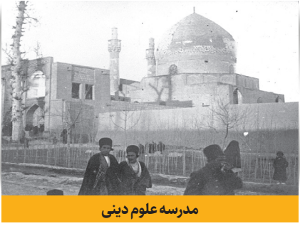
مدرسه علوم دینی