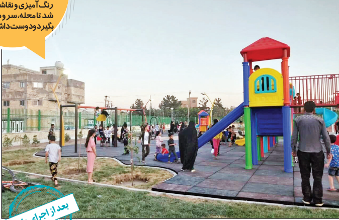
بعد از اجرای طرح

اقوام مختلف در حصه از گمنامی اجتماعی رنج می‌بردند. برای هویت‌بخشی به محله، دیوارهای اصلی محله به طول ۱۱۰ هزار متر رنگ آمیزی و نقاشی دیواری شد تا محله، سر و شکل اولیه بگیرد و دست‌داشته باشد