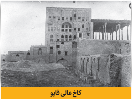
کاخ عالی قاپو