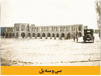
سی و سه پل