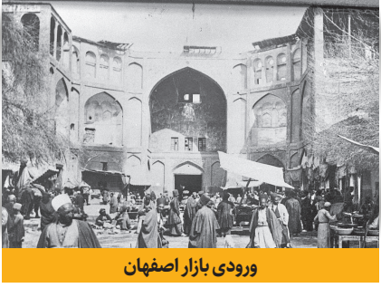
ورودی بازار اصفهان