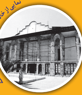
نمایی از خانه تاریخی صدراعظم در تهران

آینه کاری شده به سبک معماری سنتی ایرانی، عکس ها و نقاشی هایی هم به سبک اروپایی دارند. همچنین در تزئینات سقف این خانه می توان تصویری کارت پستالی به سبک غربی دید که روی شیشه و آینه، هنرمندان نقاشی شده اند. در گوشه گوشه این خانه می توانید عناصر مختلف معماری ایرانی را به هم قرار گرفته اند؛ از جمله حکاکی روی سنگ که در آزاره ها (روکشی در پای دیوار) و تزئینات حیاط به چشم می خوردند. گچبری هایی که استادانه در کنار آینه کاری ها خودنمایی می کنند، نمونه دیگری از ظرافت های به کار رفته در معماری این خانه قدیمی در تهران هستند. سستون گچ کاری شده این عمارت، ایوان مهمان خانه را باشکوه تر کرده و حوضی که در دست در وسط خانه و در مقابل ایوان قرار دارد، آرامش خاصی به حیاط این خانه قاجاری داده است.