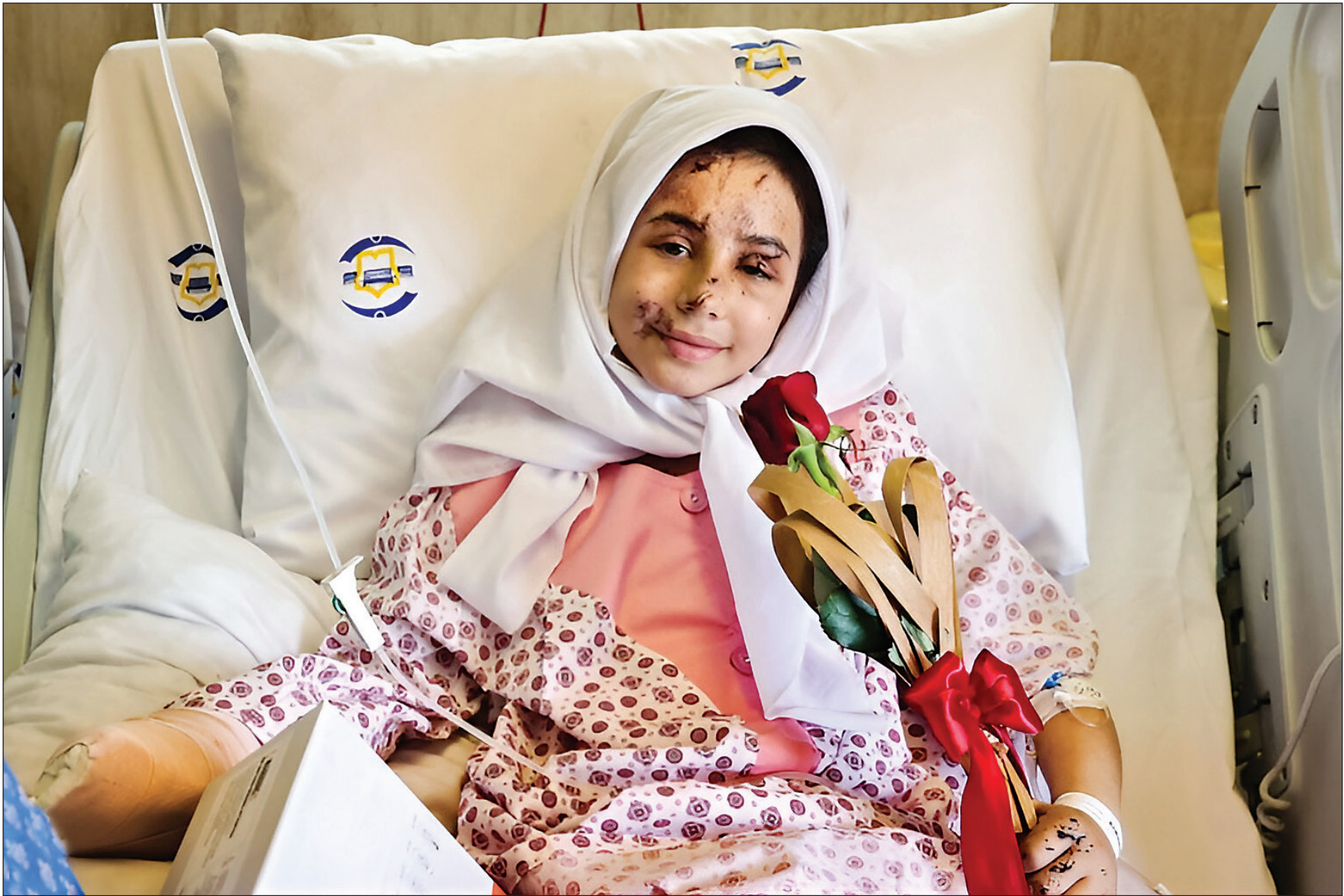
عکس: تصویرری از کودک لبنانی اسپیدید، در حادثه پیجری لبنان که به ایران منتقل شد