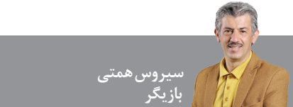
سیروش هستی بازیگر

یادم هست سالها پیش موضوع تبدیل رودر فرحزاد به یک محیط امن گردشگری در دستور کار شهردار منطقه ۲ و شهردار تهران بود و حالا خوشحالم که بعد از گذشت سالها به ثمر رسیده است. اینکه یک پروژه در چندین سال دغدغه چندین شهردار باشد نشان می دهد که پروژه بسیار مهم و کلانی است. این طرح کار قشنگ و حرکت درستی است و علاوه بر ایجاد یک محیط امن گردشگری موجب امنیت خود ساکنان فرحزاد هم شده است؛ چون تا آنجا که اطلاع دارم حضور معاندان در آنجا یک پارادوکس فرهنگی به وجود آورده بود و ساکنان آن محدوده از این موضوع ناراحت بودند. الان که متوجه شده ام این پروژه به بار نشست بسیار خوشحالم.