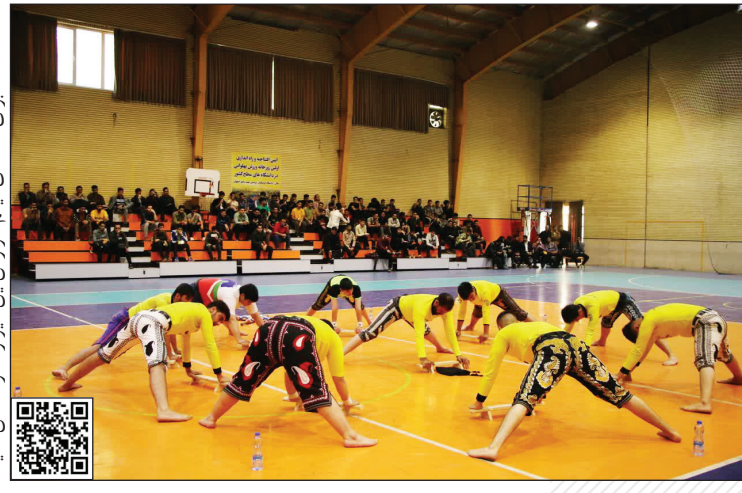
بازی تماشای فیلم گزارش این کیبوارکد اسکن کنید.

دانشگاه فرهنگیان اصفهان صاحب نخستین زورخانه دانشگاهی کشور شد