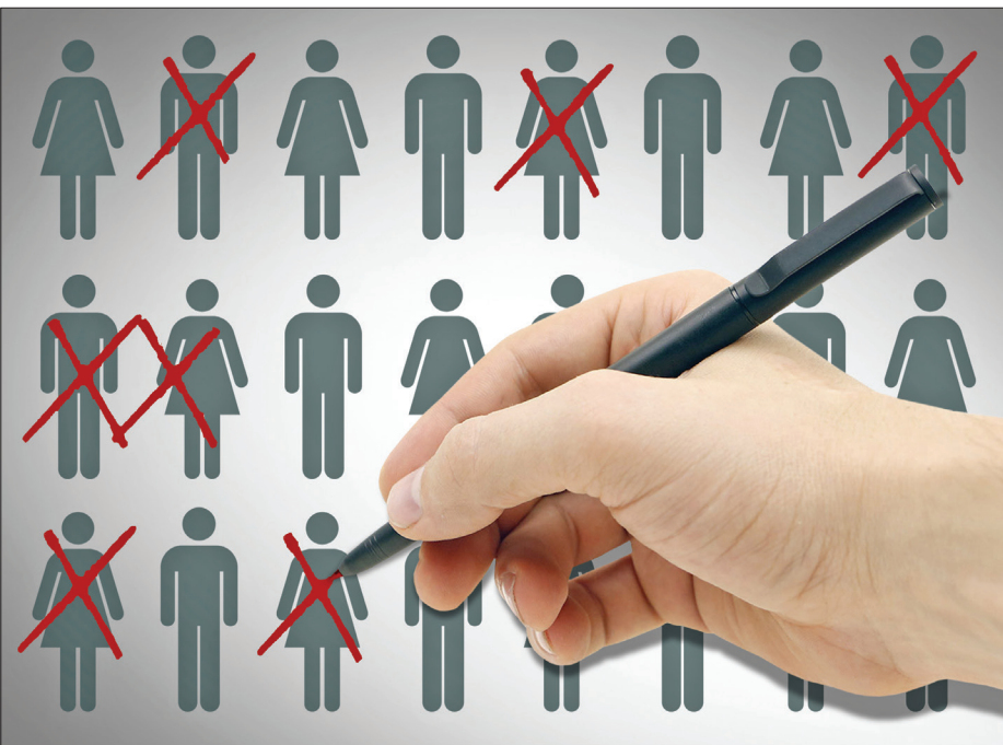
طرح همشهری/ایرام غازی

شد که مشتمل بر ۶ شاخص مالی برای تعیین وضعیت مالی خانوارهاست. به گزارش همشهری، در مصوبه هیأت وزیران، ۶ شاخص اعم از درآمد ماهانه، ارزش خودروهای تحت مالکیت، ارزش املاک، مبلغ خرید ماهانه، اقامت خارج از کشور و سفرهای خارجی به عنوان شاخص‌هایی که