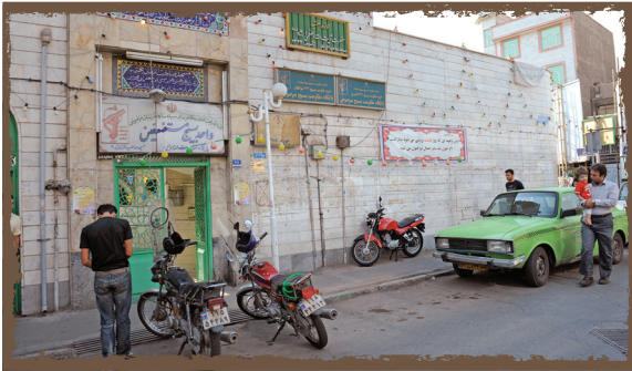
مسجد حاجیه ربابه

مسجد «توحید» یا «حاجیه ربابه» مسجدی است که داستان جالبی دارد. حاج علی مهابادی از معتمدان قدیمی محله مختاری تعریف می‌کند: «مساحت مسجد ربابه خانم ۵۰۰ مترمربع است. بانی ساخت آن حاجیه ربابه خانم از ملاکان قدیمی محله بود. کلنگ ساخت مسجد سال ۱۳۱۹ به زمین زده شد، اما تا سال ۱۳۲۱ زمان برد که این مسجد ساخته شود. در این مدت البته اتفاقی برای ربابه خانم افتاد: مباشرش با حقه‌بازی اموال او را بالا کشید و ربابه خانم برای ساخت مسجد به معمار، بنا و... بدهکار شد. البته با کمک‌های مردمی بدهی‌های مسجد صاف شد.» چهره‌های شناخته شده و تأثیر گذاری از جمله دکتر بهشتی و حجت الاسلام ناطق نوری در این مسجد حضور داشته‌اند و برای اهالی محل سخنرانی کرد. به گفته مهابادی، معماری سقف ورودی مسجد به سبک طاق ضربی است.