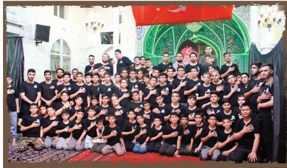
دارالایتمام در مسجد

مسجد «توحید» یا «حاجیه ربابه» مسجدی است که داستان جالبی دارد. حاج علی مهابادی از معتمدان قدیمی محله مختاری تعریف می‌کند: «مساحت مسجد ربابه خانم ۵۰۰ مترمربع است. بانی ساخت آن حاجیه ربابه خانم از ملاکان قدیمی محله بود. کلنگ ساخت مسجد سال ۱۳۱۹ به زمین زده شد، اما تا سال ۱۳۲۱ زمان برد که این مسجد ساخته شود. در این مدت البته اتفاقی برای ربابه خانم افتاد: مباشرش با حقه‌بازی اموال او را بالا کشید و ربابه خانم برای ساخت مسجد به معمار، بنا و... بدهکار شد. البته با کمک‌های مردمی بدهی‌های مسجد صاف شد.» چهره‌های شناخته شده و تأثیر گذاری از جمله دکتر بهشتی و حجت الاسلام ناطق نوری در این مسجد حضور داشته‌اند و برای اهالی محل سخنرانی کرد. به گفته مهابادی، معماری سقف ورودی مسجد به سبک طاق ضربی است.